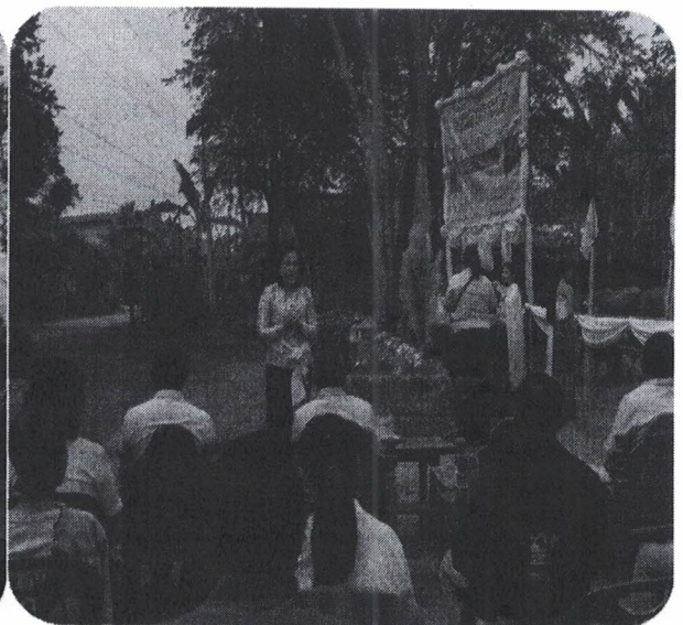
มัตที่ประชุม