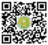
ประกาศกระทรวงเกษตรและสหกรณ์ เรื่อง แต่งตั้งเจ้าหน้าที่ตาม พรบ. มาตรฐานสินค้าเกษตร พ.ศ. ๒๕๕๑