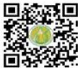
แบบคำขอมีบัตรประจำตัวพนักงานเจ้าหน้าที่ตาม พรบ. มาตรฐานสินค้าเกษตร พ.ศ. ๒๕๕๑