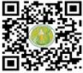
พรบ.มาตรฐานสินค้าเกษตร พ.ศ. ๒๕๖๑

ด้วยพระราชบัญญัติมาตรฐานสินค้าเกษตร พ.ศ. ๒๕๕๑ มาตรา ๔๖ กำหนดให้พนักงานเจ้าหน้าที่ต้องมีบัตรประจำตัวพนักงานเจ้าหน้าที่ตามแบบที่รัฐมนตรีประกาศ โดยพนักงานเจ้าหน้าที่ หมายความว่า ผู้ซึ่งรัฐมนตรีแต่งตั้งให้ปฏิบัติการตามพระราชบัญญัตินี้ เพื่อใช้ในการปฏิบัติหน้าที่ตามพระราชบัญญัติมาตรฐานสินค้าเกษตร พ.ศ. ๒๕๕๑